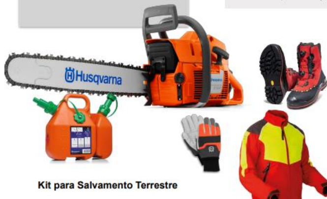
Kit para Salvamento Terrestre