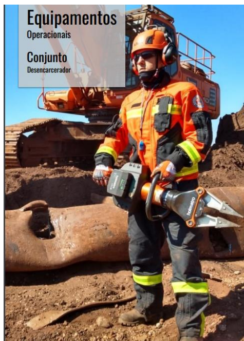
Equipamentos Operacionais Conjunto Desencarcerador