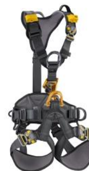
Kit para Salvamento em Altura

Kit Salvamento em Altura Custeio: R$ 26.000,00 Total: R$ 26.000,00