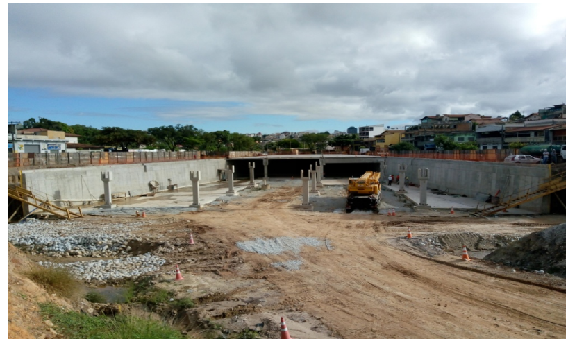
Construção de bacia de detenção– PAC Riacho Das Pedras