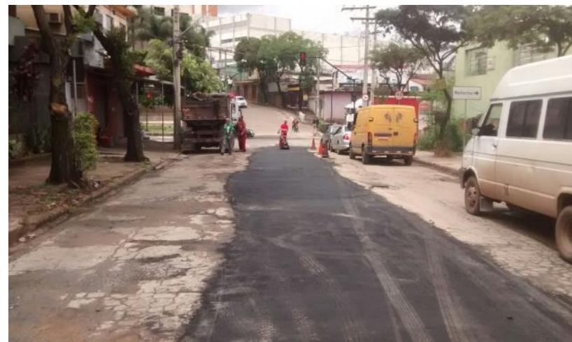
Drenagem na avenida recomposição do pavimento- PAC Complemento Arrudas