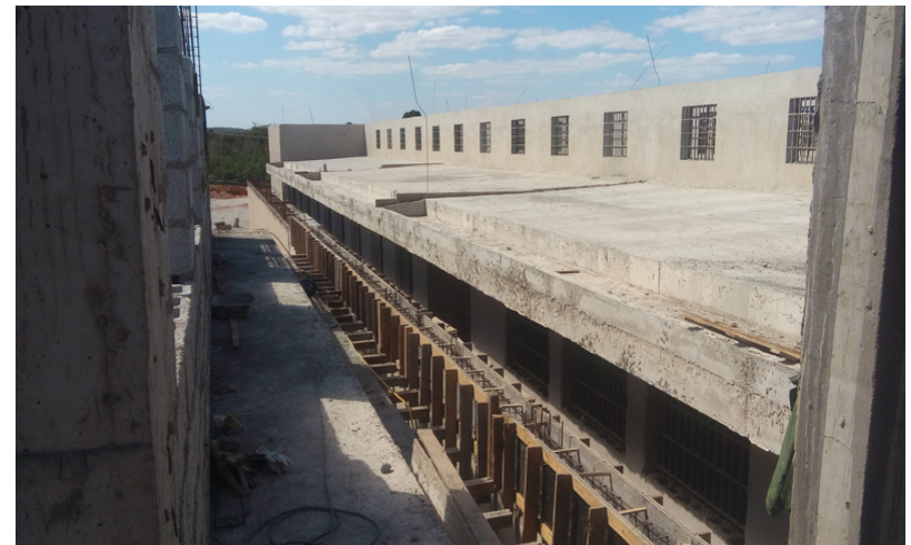
Ampliação da Cadeia Pública de Divinópolis-