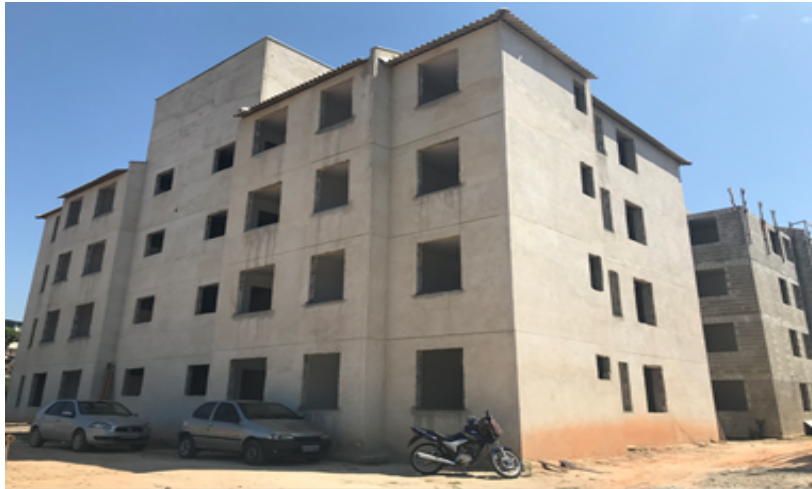
Unidades Habitacionais – PAC FERRUGEM