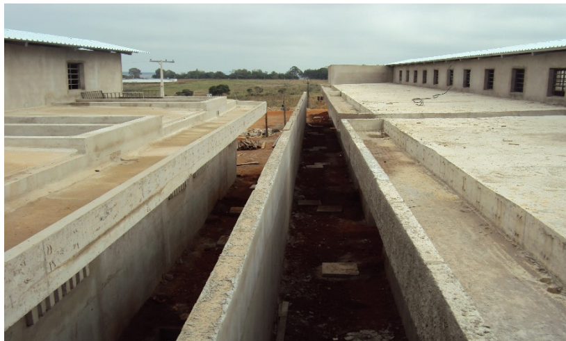
Ampliação da Cadeia Pública de Alfenas –