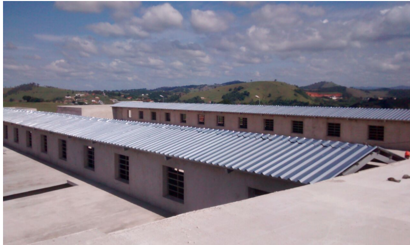
Ampliação da Cadeia Pública de Itajubá