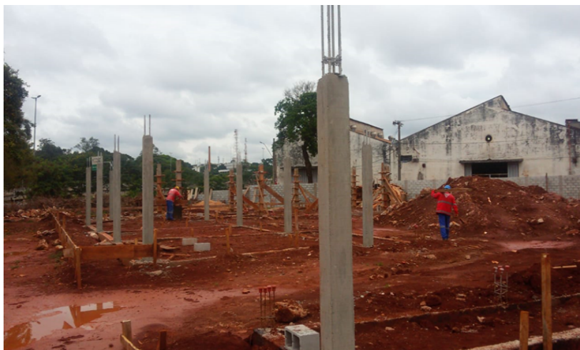
Construção do CEMEI E USF – PAC FNHIS