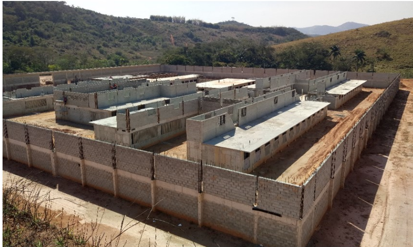
Construção da Cadeia Pública de Ubá