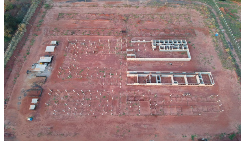
Construção da Cadeia Pública de Iturama