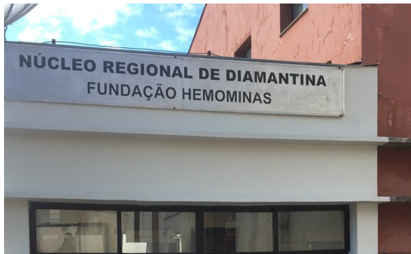
Reforma Hemonúcleo de Diamantina