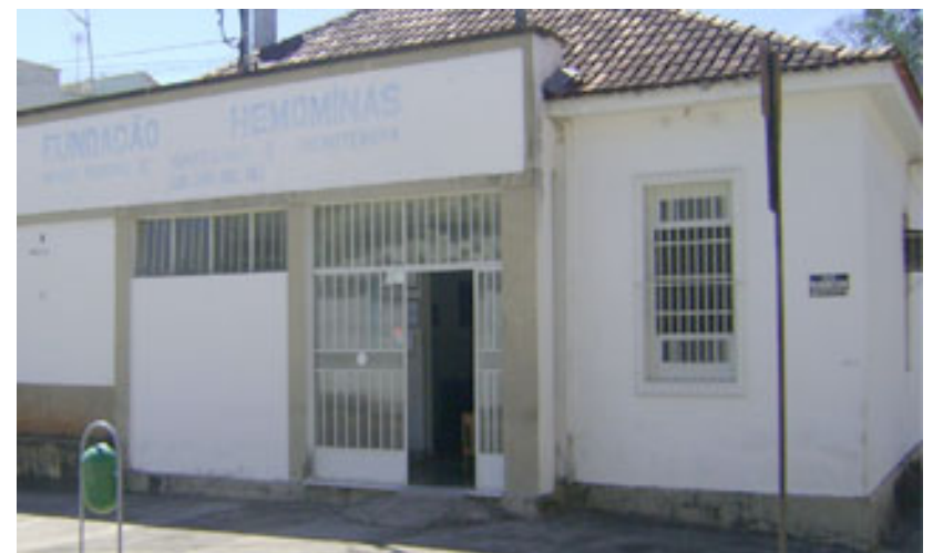
Reforma Hemonúcleo de São João del-Rei