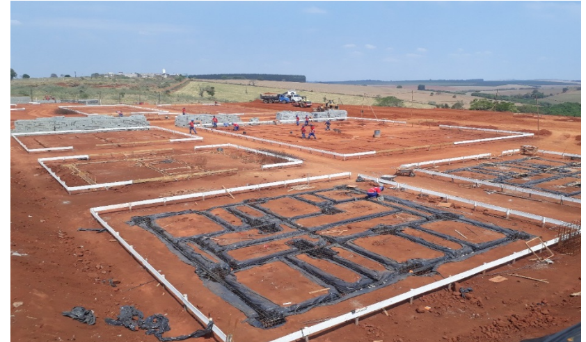
Construção do Centro Socioeducativo de Alfenas