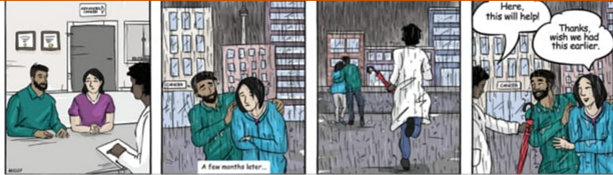
Early palliative care referral