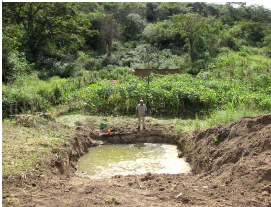
Reservatório construído para atender família assentada