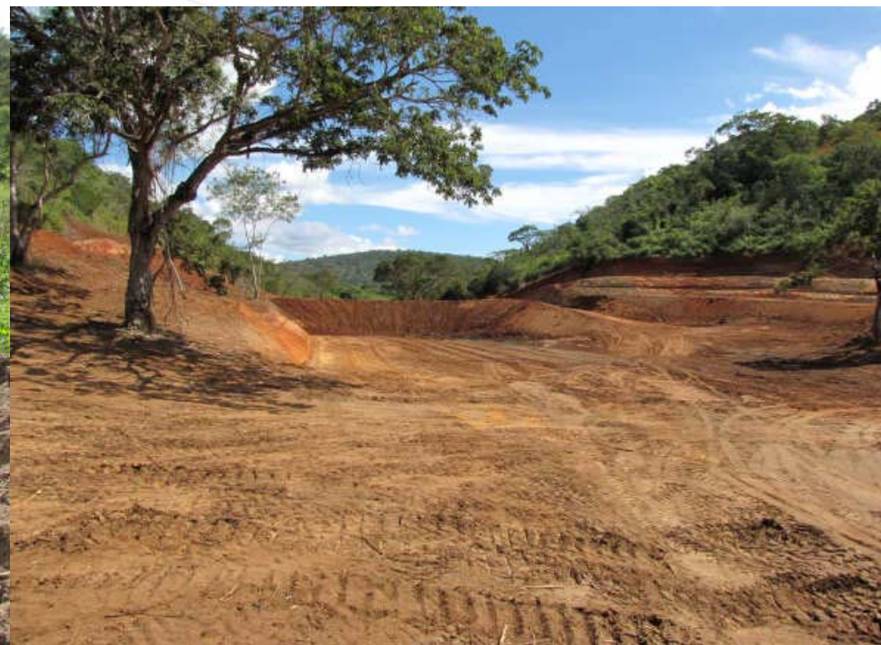
Vista da área a ser alagada – Vista a montante