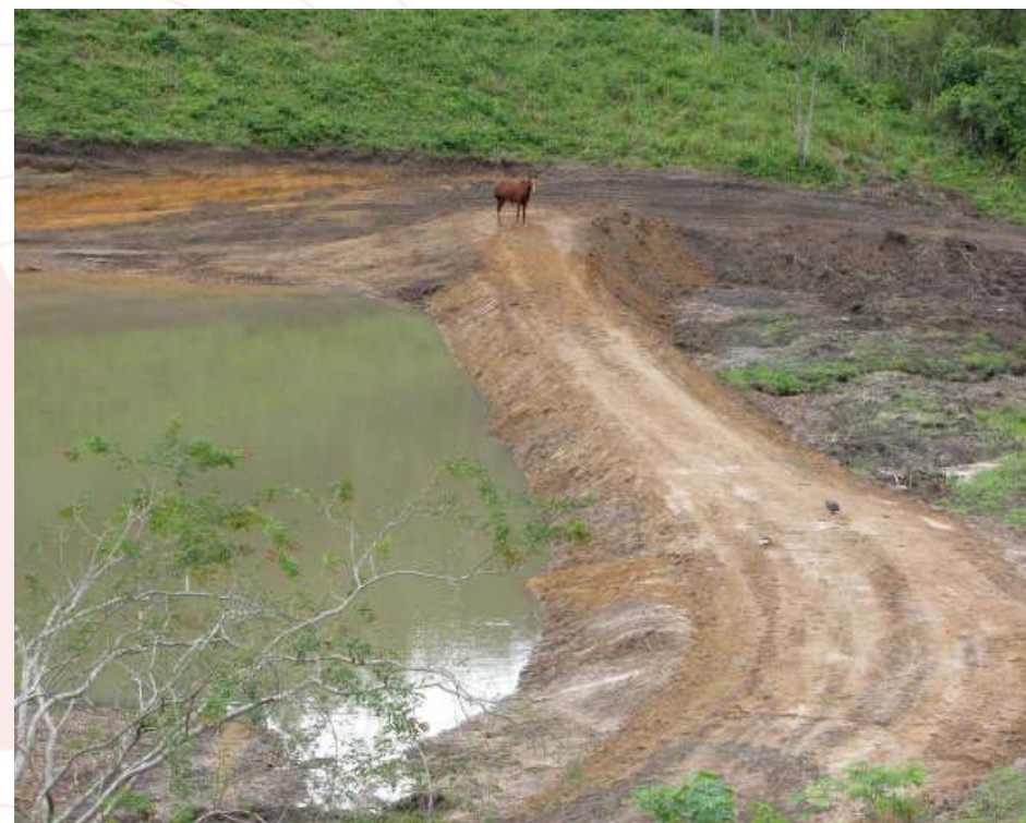
Barragem nº 2