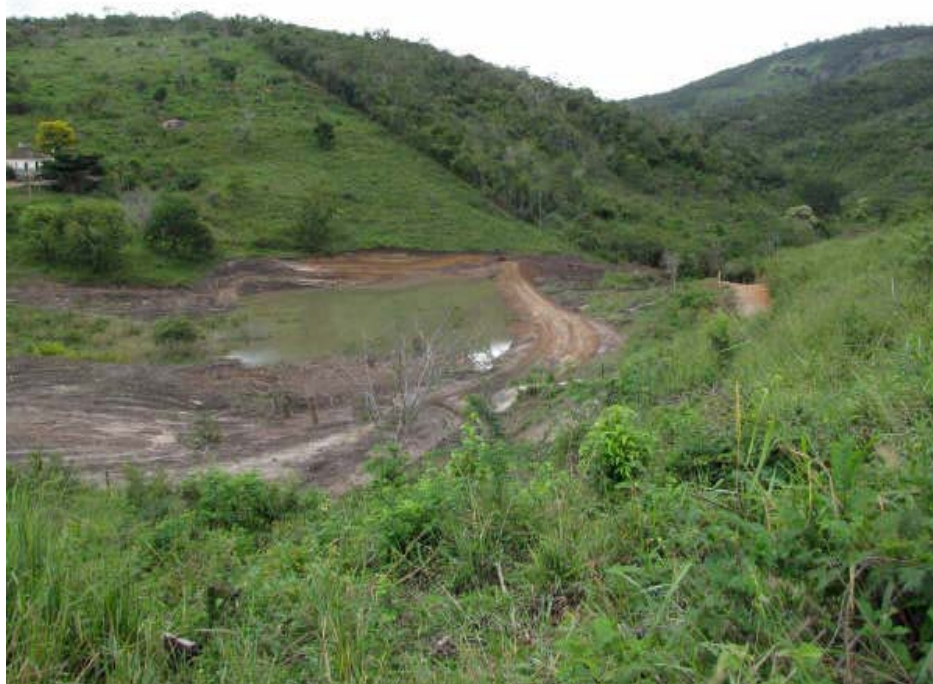
Barragem nº 1