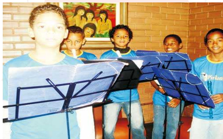
EE SÃO SEBASTIÃO - CARANGOLA