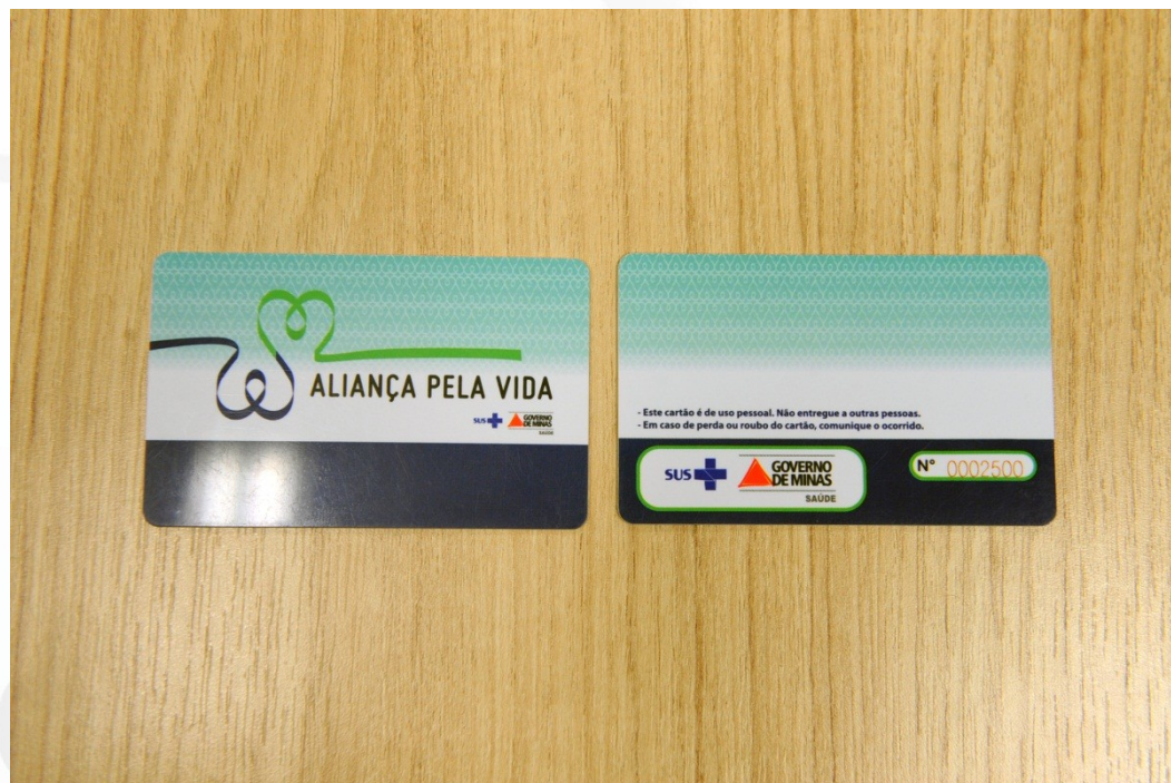
Cartão Aliança pela Vida