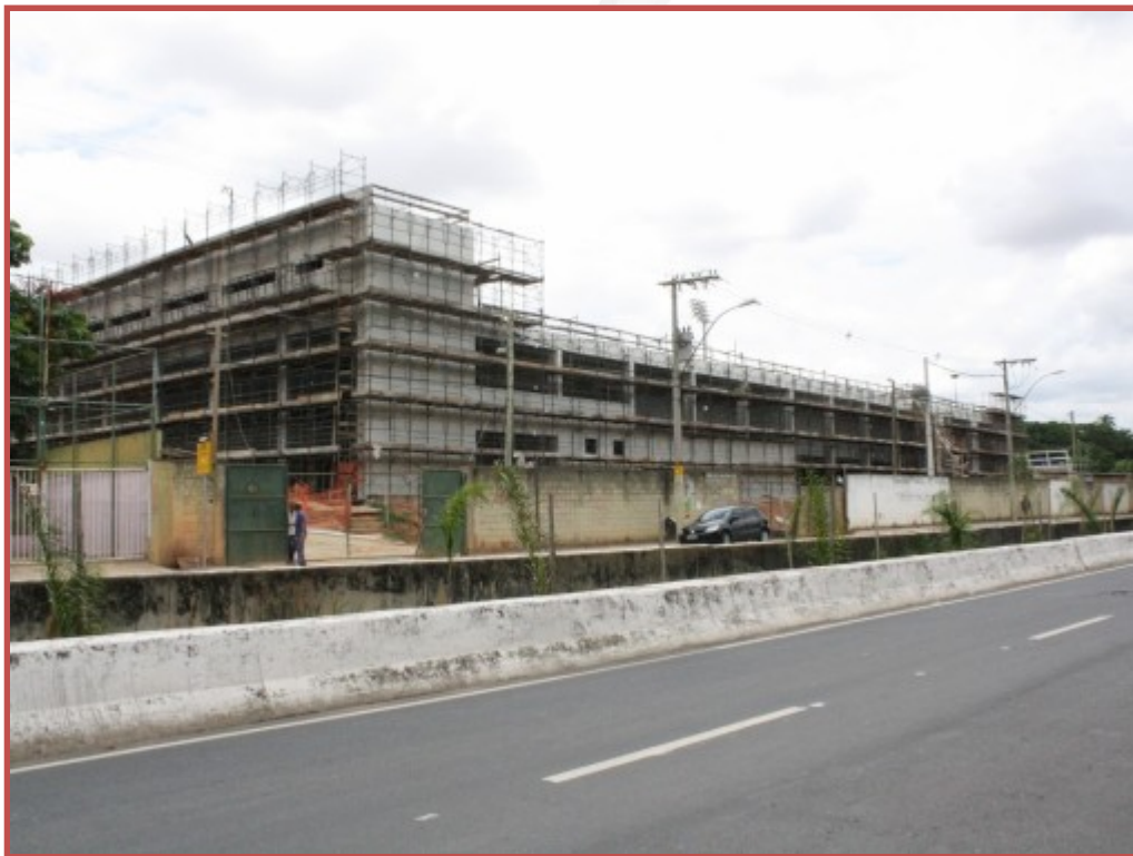
Janeiro de 2013