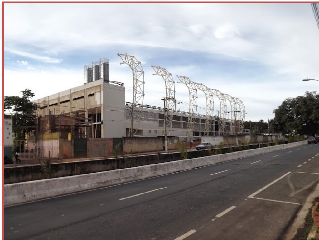
Junho de 2013