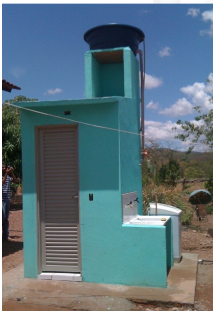
Módulos sanitários – Natalândia