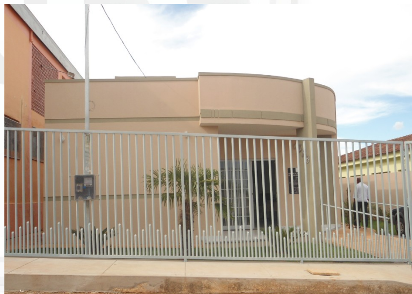
Cras – Quartel Geral