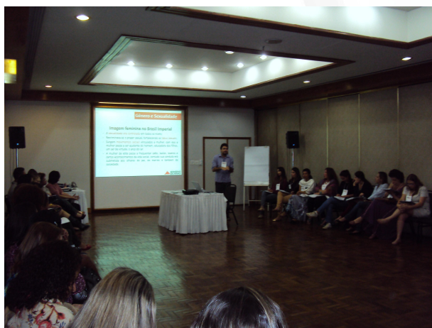
Capacitação de Coordenadores Locais