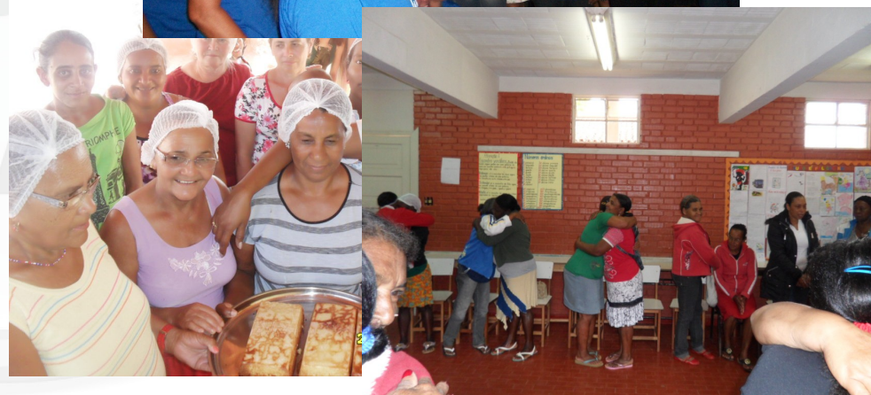
Formação Para Cidadania e Qualificação CLVL