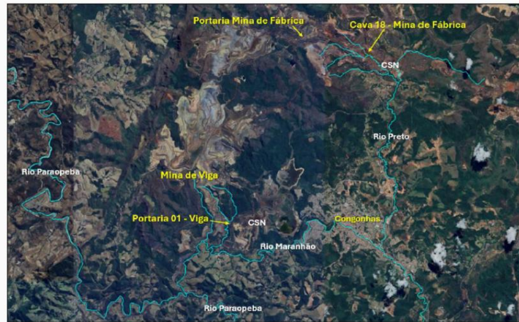
Figura 1 – Localização da mina de Viga na bacia do rio Maranhão e Paraopeba.

Objeto: apurar os danos ambientais oriundos do transbordamento de dois sumps localizados na parte mais alta da estrutura da Mina de Viga ocorrido no dia 25/01/20226 e as medidas para sua reparação integral