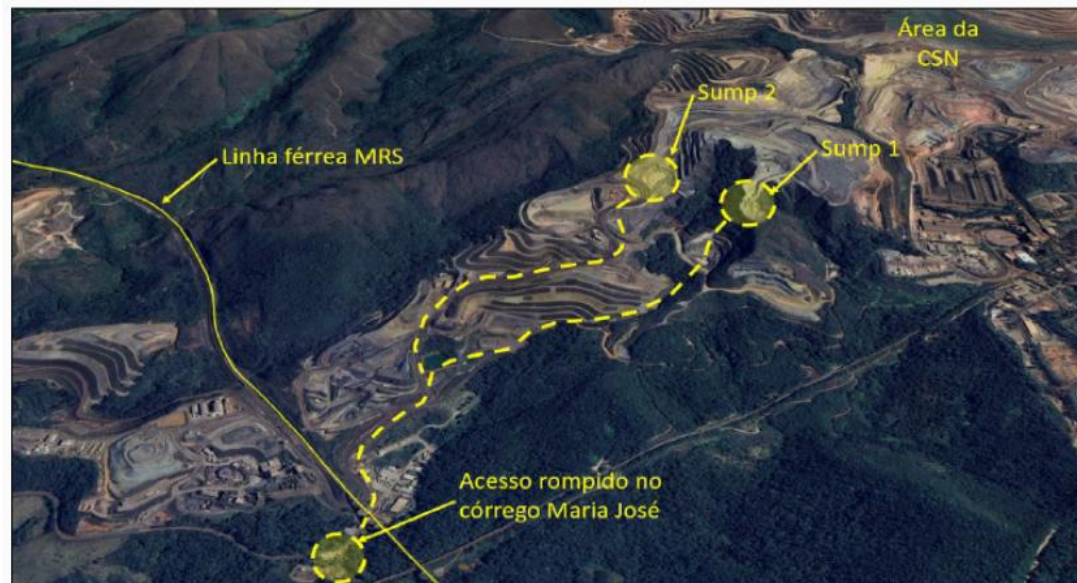
Figura 3 – Localização dos sumps e caminho aproximado dos fluxos.

sump é uma estrutura temporária da mina, uma escavação de menor proporção, tanque ou reservatório que serve fundamentalmente para controle do fluxo de água existente na cava