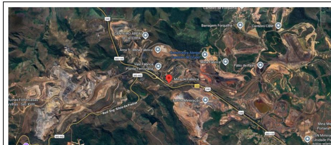
Complexo minerário Mina de Fábrica em Ouro Preto/MG e área urbana de Congonhas ao canto inferior direito.

Objeto: apurar os danos ambientais oriundos do rompimento da leira de proteção da Cava XVIII ocorrido no dia 25/01/20226 e as medidas para sua reparação integral