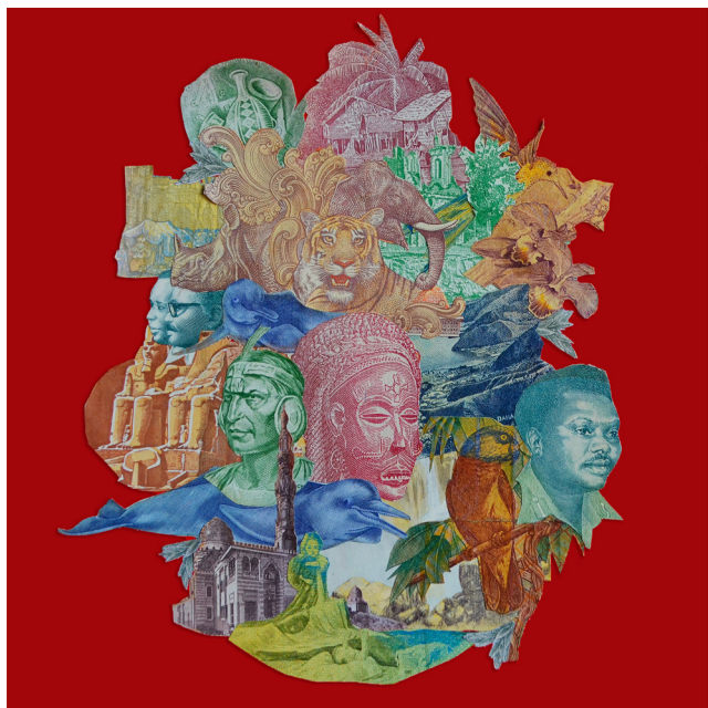
Gabriel Santana Viver vale mais que dinheiro 2023 Colagem de cédulas em tela 20 × 20 cm