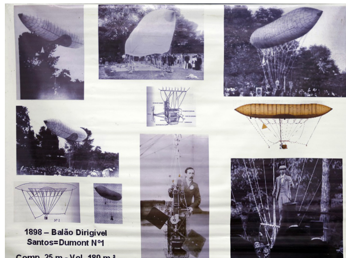
Coletivo Balões de Santos=Dumont Banner com imagens históricas