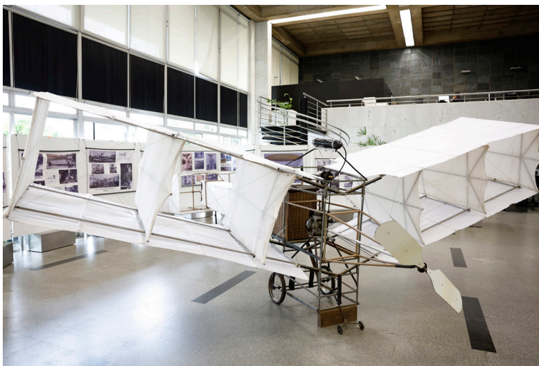
Coletivo Balões de Santos=Dumont Avião 14-bis Réplica