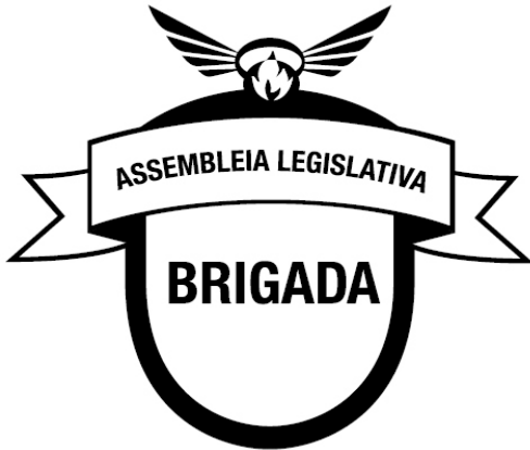
Marca monocromática em preto (aplicação em positivo).