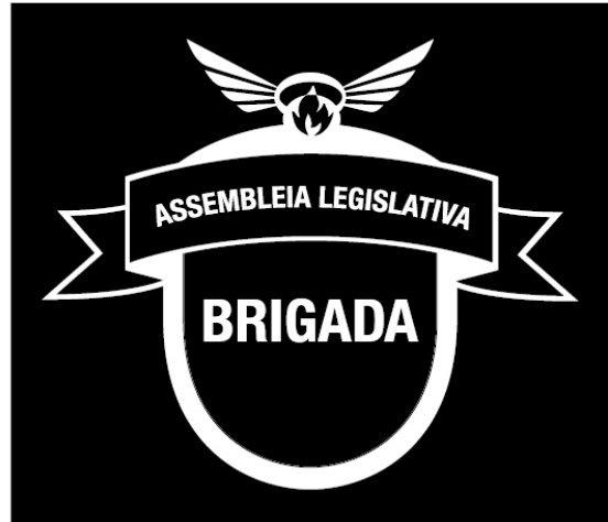
Marca monocromática em branco (aplicação em negativo).