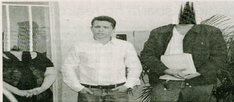
A iniciativa do abaixo assinado partiu do empresário [redacted], que em apenas um ano recebeu dezoito multas

[redacted] Depois de ter sido alvo de várias reclamações contra autuações indevidas, a Secretária de Trânsito e Transportes (Settrans) recebeu na manhã de ontem um abaixo assinado com mais de 3 mil assinaturas, reclamando contra a postura dos agentes de trânsito.