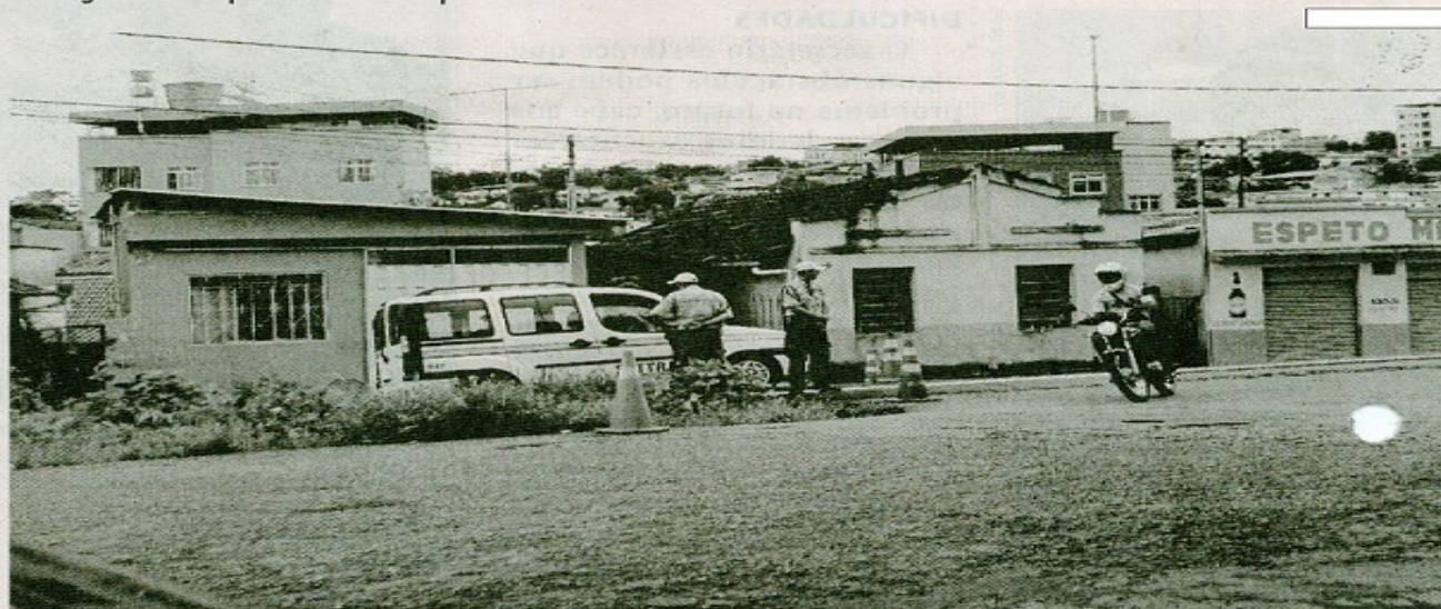
Excesso de multas pode levar à instalação de CPI

Segundo o vereador ao mostrar o estudo à população ele