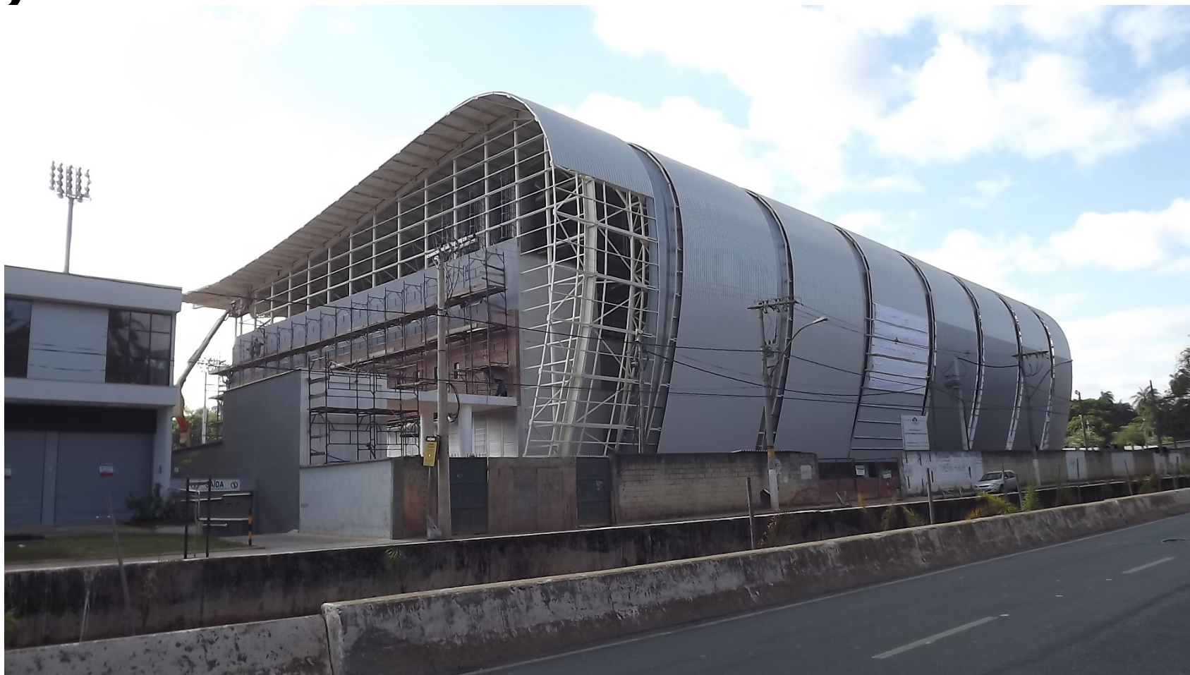
Imagens da obra em outubro 2014