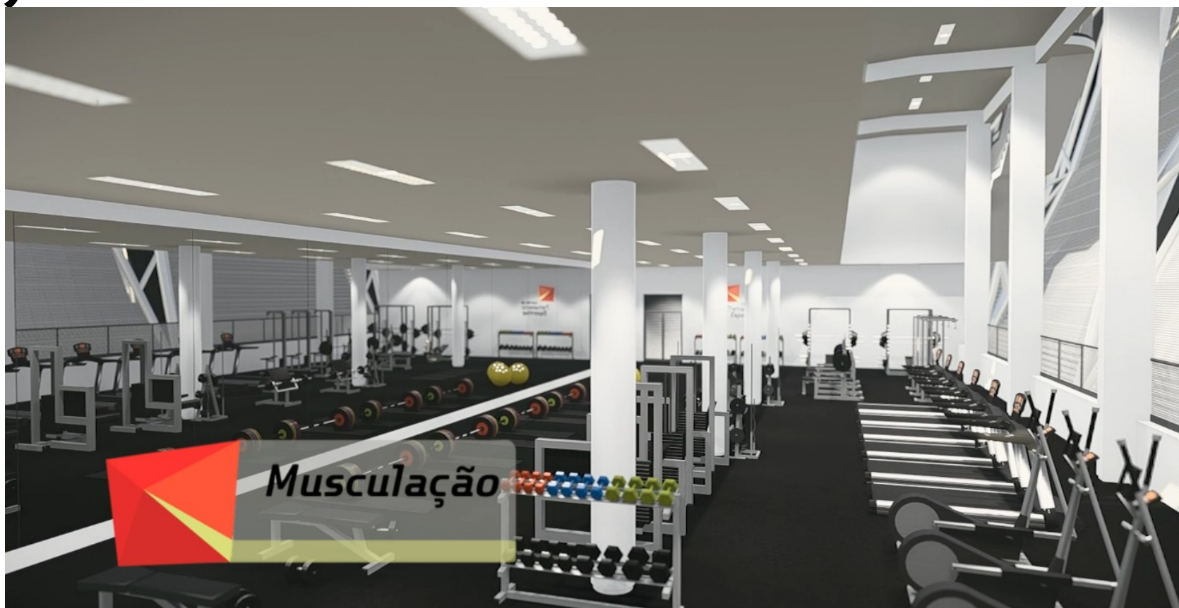
Projeto Arquitetônico da Sala de Musculação