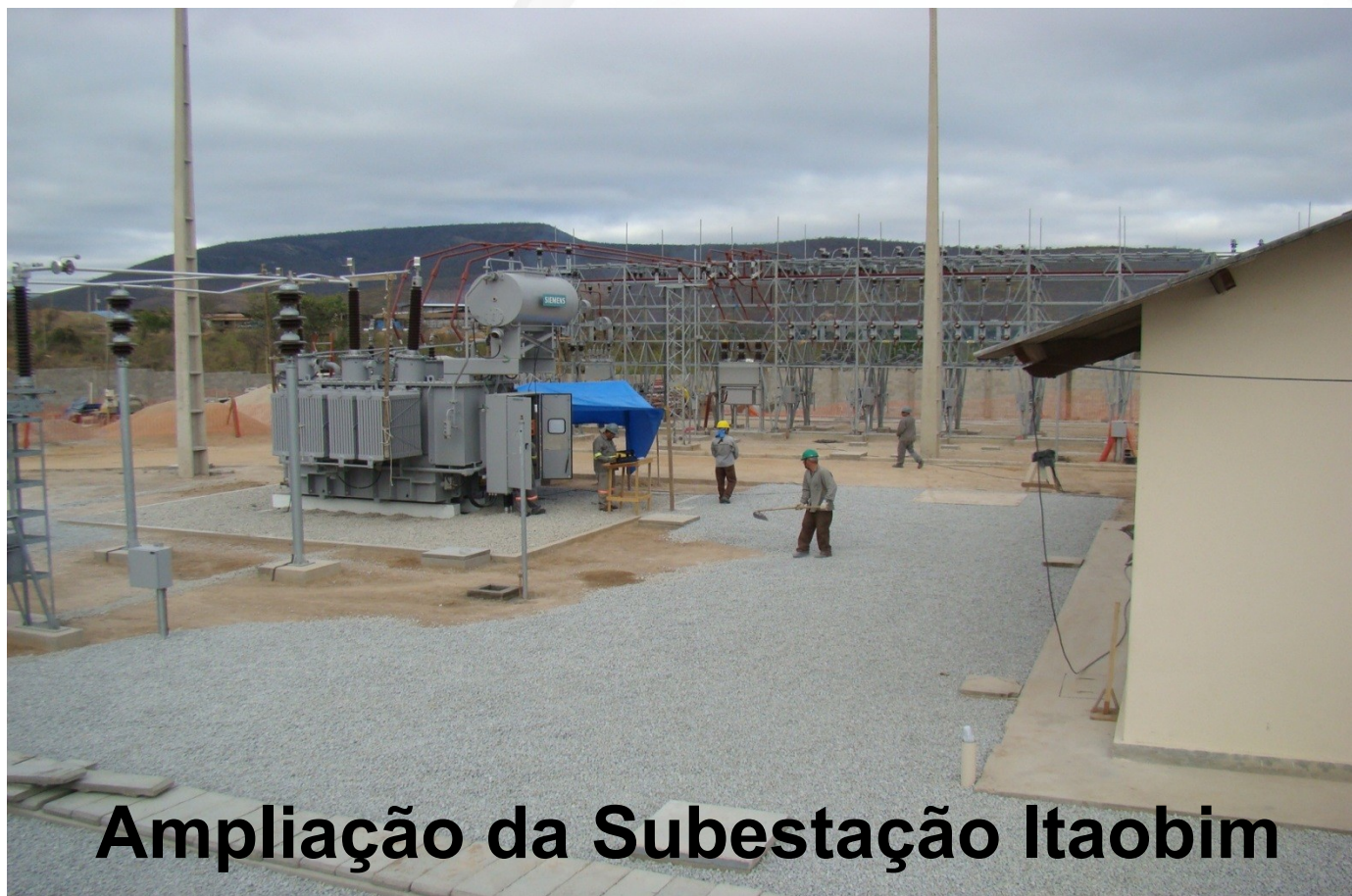
Ampliação da Subestação Itaobim

AUDIÊNCIAS PÚBLICAS DE REVISÃO DO PPAG 2014