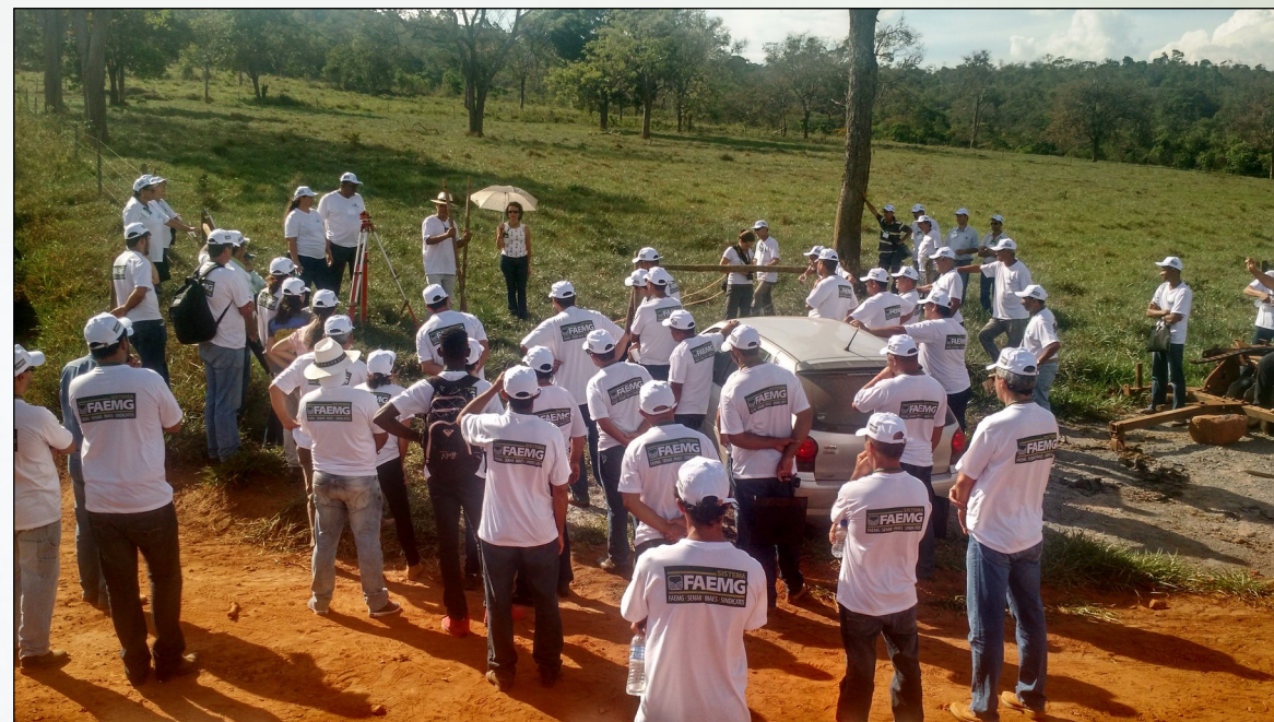
DIA DE CAMPO - Conservação de água e solo

“Estamos muito gratos por essas ações que devolveram vida à nossa propriedade, que fica às margens do córrego Arrozal. Aqui foram construídas cerca de 25 barraginhas. Estamos conseguindo recuperar as nascentes e o córrego. Queremos ser modelo para outros produtores do município. A escassez de água é muito séria, mas, se todos tiverem consciência e fizerem um pouquinho, tenho certeza que